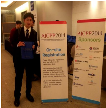
学会参加手続きの様子