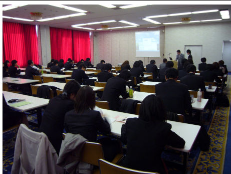
会場風景（口頭発表）