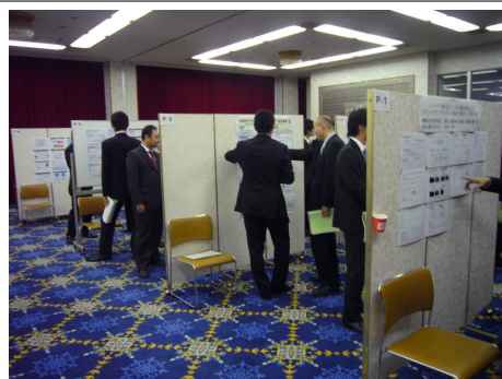
会場風景（ポスター）